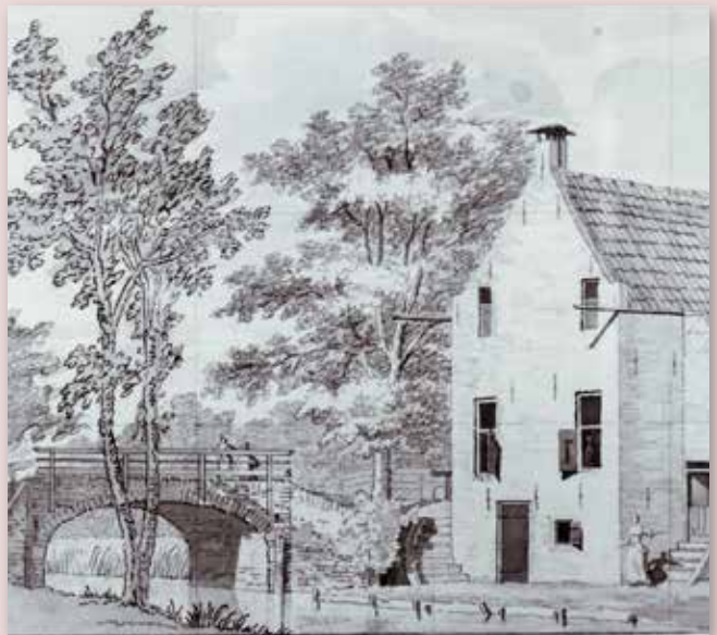
De brug over de Doorslag voor de weg van Jutphaas naar IJsselstein - daar waar nu een hoge houten brug is en vroeger de dam tussen Doorslag en IJssel was. Deze prent is van 1761.