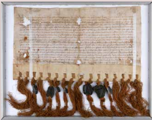
De oorkonde waarin de bisschop van Utrecht 1295 stadsrechten aan 't Gein verleent.

'Er was eens, zo beginnen sprookjes. Ze zijn niet echt gebeurd. Deze verhalen, die ik jullie vertel, zijn wel echt gebeurd en ze gaan over de vestigingsplaats 't Gein, dat in 1295 stadsrechten kreeg.'